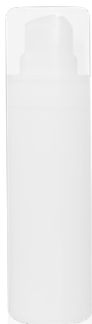
Inhalt: 30 ml Spender

Die activa medica AHA Creme plus C ist eine intensiv wirksame Fruchtsäurecreme, geeignet für reife Haut. Die Kombination von Fruchtsäuren und Vitamin C verbessert durch den keratolytischen Effekt die Hautstruktur, fördert die Hydratation und regt bei langfristiger Anwendung die Collagensynthese an. Phytosterole aus Olive und Raps stärken die Hautbarriere. Weintrauben-Extrakt und Grüner-Tee Extrakt schützen als Radikalfänger vor oxidativem Stress. Riboflavin stimuliert die Regenerationsprozesse der Haut.