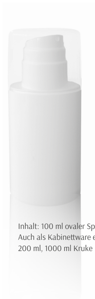
Inhalt: 100 ml ovaler Spender Verkaufsware Auch als Kabinettware erhältlich: 200 ml, 1000 ml Kruke

Die activa medica Gelmaske mit Aloe Vera hat durch ihre Gelformulierung einen angenehm erfrischenden und kühlenden Effekt auf der Haut und ist auch als entspannendes Massagegel geeignet. Aloe Vera kann irritierte Haut beruhigen und spendet viel Feuchtigkeit. Hamamelis Extrakt hat entzündungshemmende Eigenschaften. Mit diesen Inhaltsstoffen kann die Gelmaske Hautirritationen, z.B. bei Akne, helfen zu reduzieren. Der kühlende Effekt kann bei Sonnenbrand und Insektenstichen helfen.