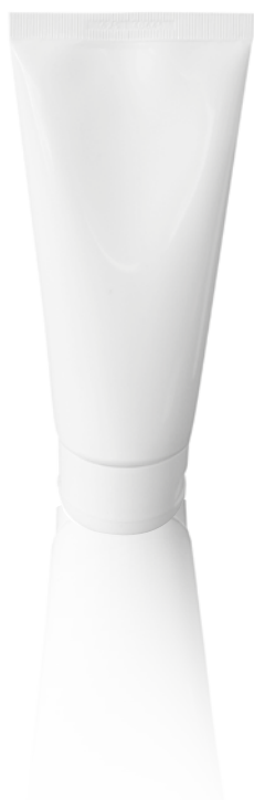
Inhalt: 75 ml Tube

Die activa medica Handcreme ist speziell für die täglich belasteten Hände entwickelt worden. Die Creme bildet einen kaum fettenden Schutzfilm auf der Haut und pflegt trockene und raue Haut zart und geschmeidig. Phytosterole aus dem Raps sind im molekularen Aufbau dem Hydrolipidfilms der Haut ähnlich und können ihn ergänzen. Dadurch wird die Hautbarriere gestärkt und der transepidermale Wasserverlust reduziert. Squalan unterstützt diesen Effekt. Panthenol und Allantoin wirken feuchtigkeitsspendend und beruhigen gereizte Haut. Ein leichter UV-Filter schützt vor lichtbedingter Hautalterung.