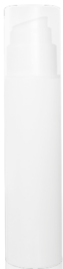
Inhalt: 50 ml Spender

Die activa medica Med LSF 50+ ist eine leichte Gelcreme mit sehr hohem UV-A-/UV-B-Schutz und für die empfindliche sowie fettende und zu Unreinheiten neigende Haut geeignet. Sie schützt Areale, die der Sonne besonders intensiv ausgesetzt sind, wie Gesicht, Hals, Dekolleté und Hände, vor UV-bedingter Hautalterung.