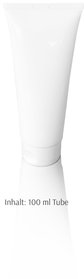
Inhalt: 100 ml Tube

Die activa medica Creme Med plus 40% Urea wurde für besonders trockene Haut und zu Hyperkeratosen neigende Haut entwickelt. 40% Urea hat einen starken keratolytischen Effekt und kann übermäßige Verhornung bei verhärteter und zu Rhagaden neigender Haut reduzieren. Urea spendet der Hornschicht Feuchtigkeit und macht sie somit geschmeidiger.