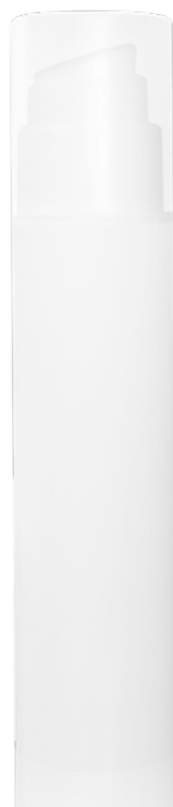
Inhalt: 50 ml Spender

Die activa medica AHA Creme ist eine effektive und gleichzeitig milde Emulsion mit Fruchtsäure-Komplex. Die leicht keratolytischen Eigenschaften der Fruchtsäuren regen die Haut zur Zellneubildung an und spenden Feuchtigkeit. Grüner-Tee-Extrakt hat ebenfalls anregende Eigenschaften. Vitamin E und der Extrakt aus Weintrauben schützen als Radikalfänger vor oxidativem Stress. Rapsöl pflegt die Haut geschmeidig.