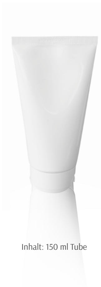
Inhalt: 150 ml Tube

Die activa medica Sonnenlotion SPF 30 enthält UV-A- /UV-B-Breitbandfilter, die Haut wird bestmöglich geschützt. Soja Extrakt entfaltet durch Isoflavone seine photoprotektiven Eigenschaften. Panthenol spendet Feuchtigkeit und stimuliert die Hautregeneration. Vitamin E schützt vor freien Radikalen und oxidativem Stress. Diese Wirkstoffe können lichtbedingte Hautalterung reduzieren. Die leichte Formulierung ist leicht aufzutragen und hinterlässt keinen weißen Film auf der Haut.